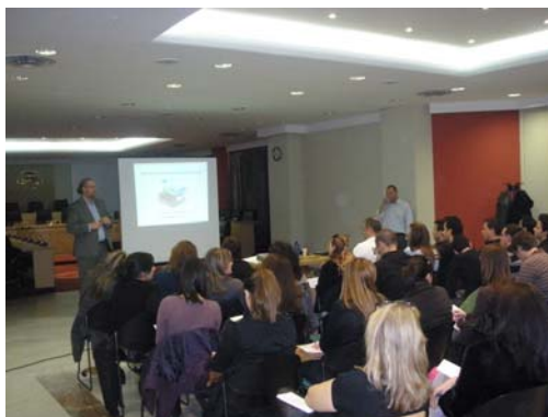
Φ.3: Σεμινάριο για τις εφαρμογές των νέων τεχνολογιών στην Αίθουσα του Δημοτικού Συμβουλίου

Σημαντική θέση στις δράσεις του Κέντρου έχουν οι πρωτοβουλίες επιχειρηματικής κατάρτισης. Στα δύο χρόνια της λειτουργίας του έχουν πραγματοποιηθεί 3 σεμινάρια, όπου συμμετείχαν περισσότερα από 100 άτομα και εισηγήθηκαν 7 σύμβουλοι επιχειρήσεων και καλύφθηκαν τουλάχιστον 8 θεματικές ενότητες.