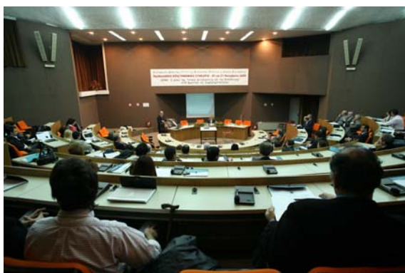
Φ.4: Πανοραμική φωτογραφία από το Πανελλήνιο Συνέδριο Επιχειρηματικότητας

Τέλος, τον περασμένο Νοέμβριο έχει συνδιοργανώσει με απόλυτη επιτυχία, μαζί με την ΚΔΕΚΠΑΚ, το 1 ο Πανελλήνιο Επιστημονικό Συνέδριο με τίτλο «Ο ρόλος της τοπικής αυτοδιοίκησης και της εκπαίδευσης στην ανάπτυξη της επιχειρηματικότητας», στο οποίο εισηγήθηκαν ακαδημαϊκοί καθηγητές, στελέχη της επιχειρηματικής κοινότητας, και εκπρόσωποι πρωτοβουλιών ενίσχυσης της επιχειρηματικότητας από την Ελλάδα και το εξωτερικό.