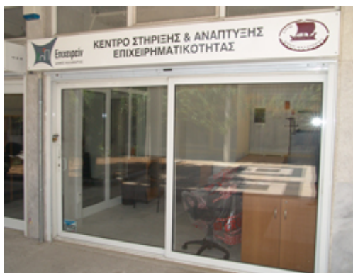
Φ.1: Το Κέντρο Στήριξης & Ανάπτυξης Επιχειρηματικότητας

Βρίσκεται στην Δημοτική Αγορά του Φοίνικα και λειτουργεί καθημερινά για το κοινό από τις 10 π.μ. – 2 μ.μ., ή εναλλακτικά εκτός ωραρίου με προσωπικά ραντεβού.